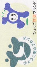
ひょうご推奨ブランド

県産の農・畜・水産物および加工食品で「安全・安心」かつ「個性・特長」がある食品を「兵庫県認証食品」として認証。「推奨ブランド」と、残留農薬等が国基準の10分の1以下など、より厳しい基準をクリアした「安心ブランド」の2種類があります。